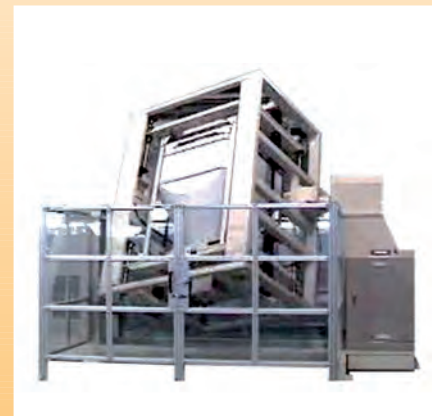
Mélangeur de conteneur