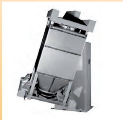
Mélangeur de conteneur