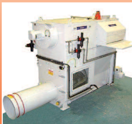
Vide sacs automatique acier peint