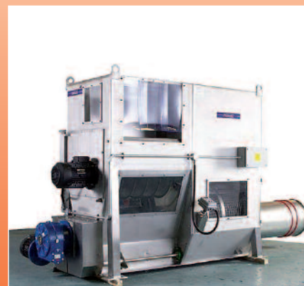
Vide sacs automatique version alimentaire